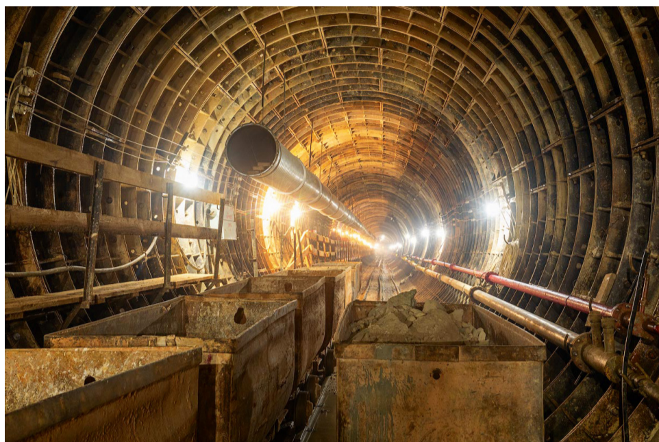
Обходной тоннель Кольцевой линии

Проектом предусмотрено два вестибюля, один из которых, подземный, появится на пересечении улицы Дурова с Делегатской и Самарским переулкам, а второй, надземный, построят у перекрестка Олимпийского проспекта с улицей Дурова и соединят со станцией 350-метровым подземным переходом с траволатором. Это будет первый такой переход в Московском метро.