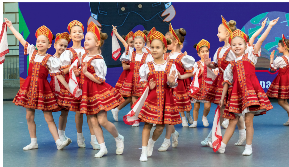
Гала-концерт детского творчества