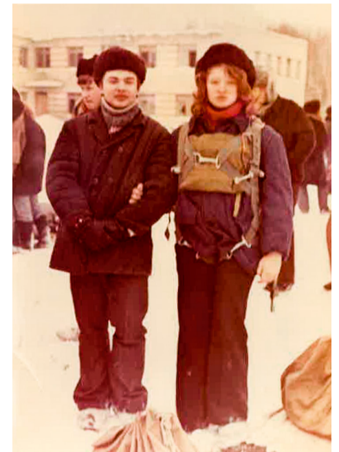
Девушка тренировалась сама и помогала освоить азы новеньким

Изначально лаборатория занимала небольшое пространство. Сегодня она значительно увеличилась по площади,