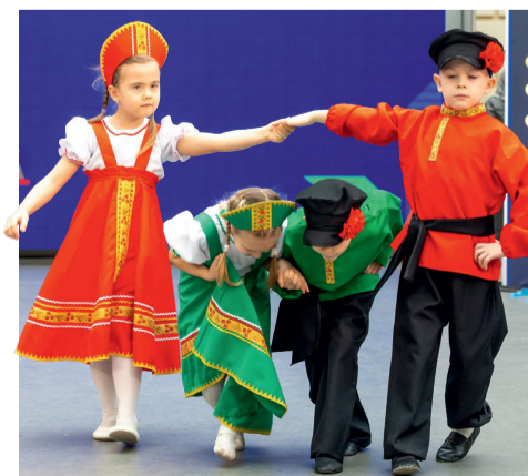
Воспитанники детских садов Мосметростроя

По итогам фестиваля дети и их родители получили массу приятных эмоций и узнали больше о других культурах, а педагоги дошкольного образования обменялись профессиональным опытом и обсудили практические вопросы развития отрасли. Кроме того, все участники дошколята и лучшие педагоги получили награды из рук организаторов.