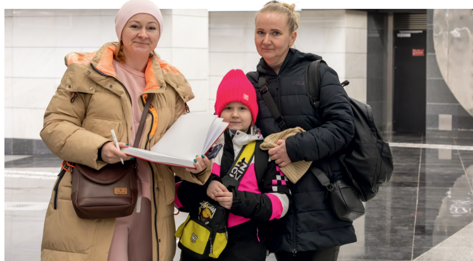
На станции «Авиамоторная»