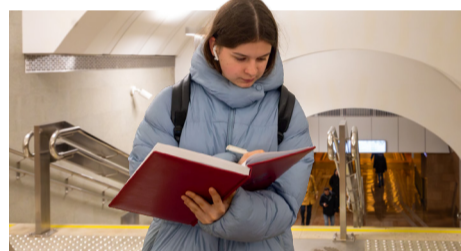
На станции «Электрозаводская»