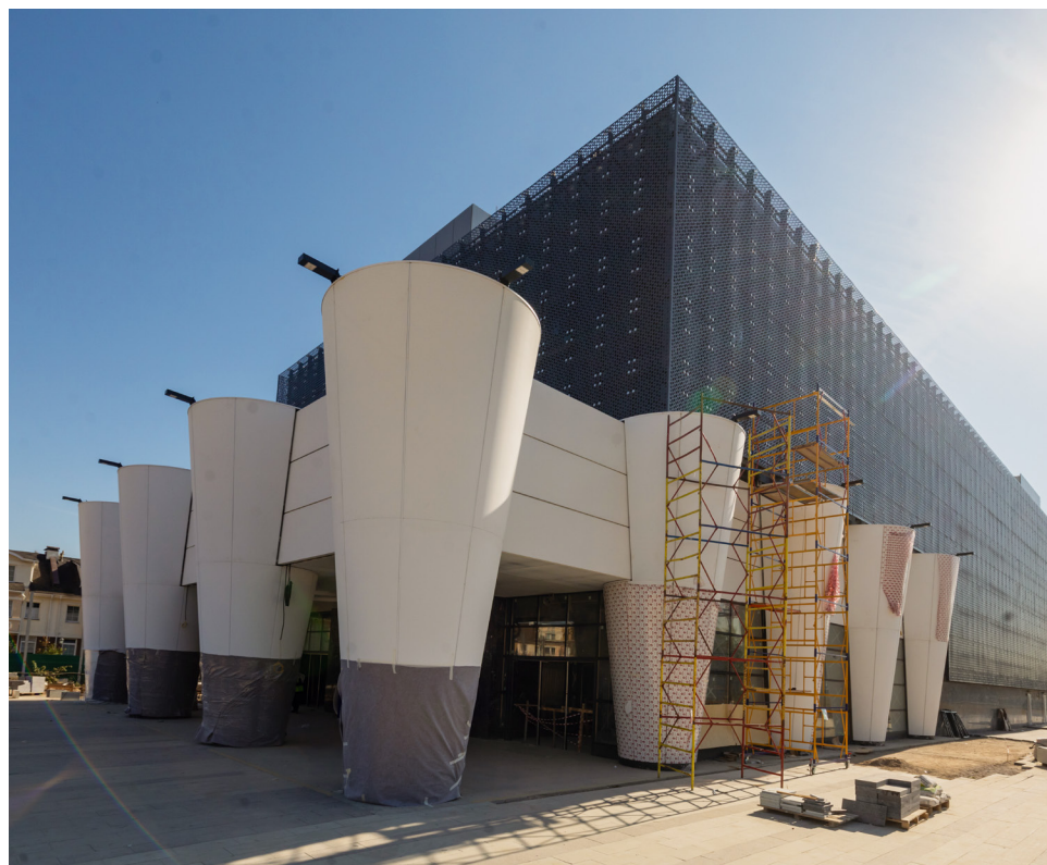
Второй вестибюль со зданием эксплуатационного персонала

Вестибюль совмещен со зданием эксплуатационного персонала, которое состоит из семи уровней – четырех подземных и трех наземных. На первом наземном этаже размещен кассовый зал, а на подземных уровнях и двух верхних этажах располагаются служебные и технические помещения. На уровне третьего