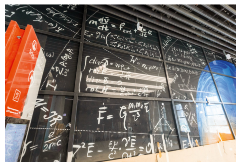
Отделка практически завершена

Работы идут по графику. Скоро пассажиры, идущие от нового жилого комплекса, смогут экономить около 300 метров пути до подземки.