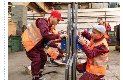
Сборка соединительного ящика

В СМУ-24 Метростроя прошел конкурс профессионального мастерства «Лучший специалист (монтажник) слаботочных систем».