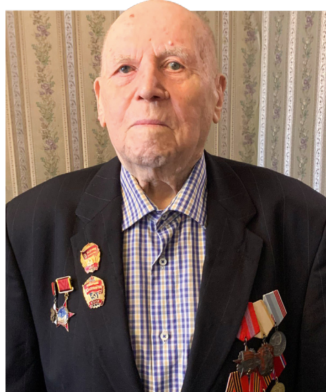
Иван Гагарин, сентябрь 2024 г.